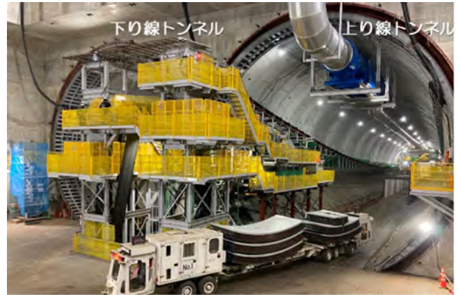
回転立坑内の状況(R6.11撮影)