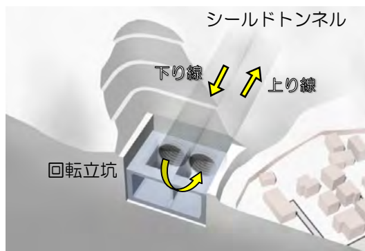
回転立坑イメージ

地理院地図(国土地理院) ( https://www.gsi.go.jp ) をもとに、東日本高速道路㈱が加工